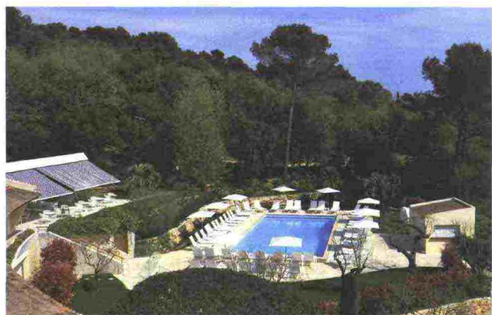
A destra. Il borgo di Sait Paul de Vence. Un dedalo di stradine che si snoda tra le dimore in pietra tra le colline fa di questo comune una gemma d'architettura sopravvissuta al tempo. A sinistra. L'Hotel La Vague de Saint Paul con la sua meravigliosa struttura architettonica sinuosa immersa nel verde