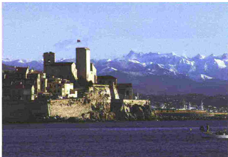
L'Hotel 5 stelle Cap d'Antibes. A destra, uno scorcio di Antibes, dove è possibile visitare il Musée Picasso che si trova nel Castello Grimaldi che contiene tutte le opere che Pablo Picasso eseguì durante il suo soggiorno ad Antibes, nel 1946. Fra le altre la notissima e acclamata Joie de vivre

ANTIBES JUAN LES PINS Antibes, a metà strada tra Nizza e Cannes, con i suoi anfratti che si tuffano nel Mediterraneo, rappresenta il "dolce far niente" tinto d'azzurro e bianco, come le nuvole che si specchiano nel mare. Chi volesse soggiornare a Cap d'Antibes gustandone appieno la vitalità senza rinunciare all'intimità può affidarsi all'ospitalità del 5 stelle Cap d'Antibes Beach Hotel, trasformato dalla Famiglia Ferrante in Hotel di lusso e appartenente dal gennaio 2010 alla catena Relais et Chateaux. Affacciato direttamente sul mare che lambisce una candida spiaggia privata attrezzata di ogni confort, l'Hotel sposa un'atmosfera rilassata e un design contemporaneo, in cui l'architettura leggera dà voce ai colori pastello degli interni in legno che ben si armonizzano con quelli della vegetazione circostante. 12 stanze Deluxe, 10 Privilege e 5 Suite offrono agli ospiti un'accoglienza al tempo casual e chic, insieme al "Summer Beach Wellness" e ai due ristoranti, "Les Pecheurs" sulla omonima spiaggia (una stella Michelin) e "Le Cap". www.ca-beachhotel.com