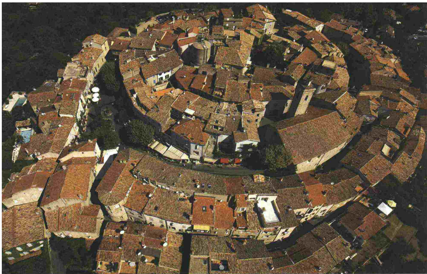
L'incantevole villaggio di Mougins. Pablo Picasso vi passò gli ultimi 15 anni della sua vita, e vi morì, per un attacco di cuore l'8 aprile 1973