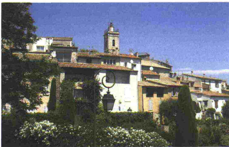
L'Hotel 5 stelle Le Mas Candille a Mougins